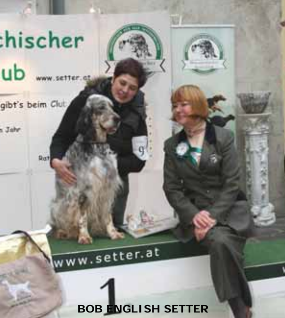
BOB ENGLISH SETTER