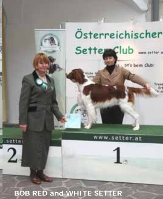
BOB RED and WHITE SETTER