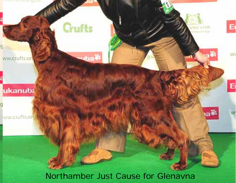
Northamber Just Cause for Glenavna