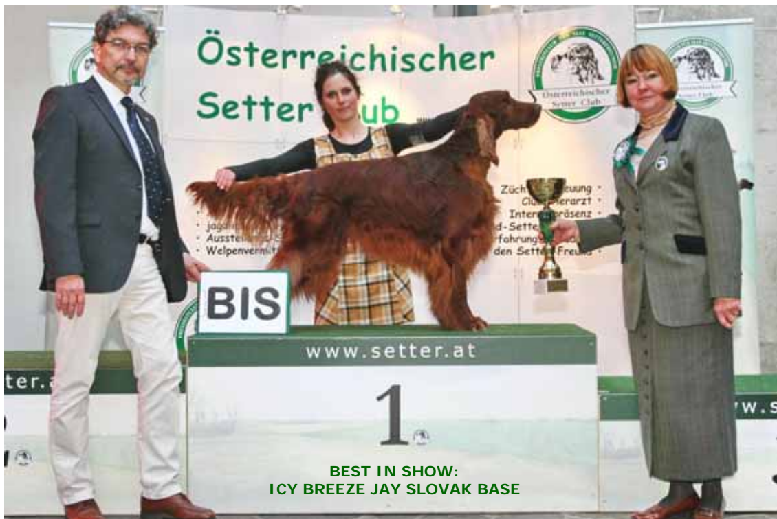
BEST IN SHOW: ICY BREEZE JAY SLOVAK BASE

Züchtereinweisung • Club-Tierarzt • Zertifikatsprüfung • Internenpräsenz • Erfahrungswettbewerb • den Setter-Freund