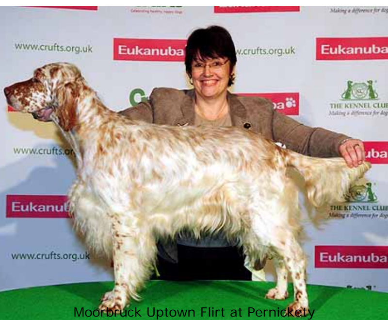
Moorbrück Uptown Flirt at Pernickety