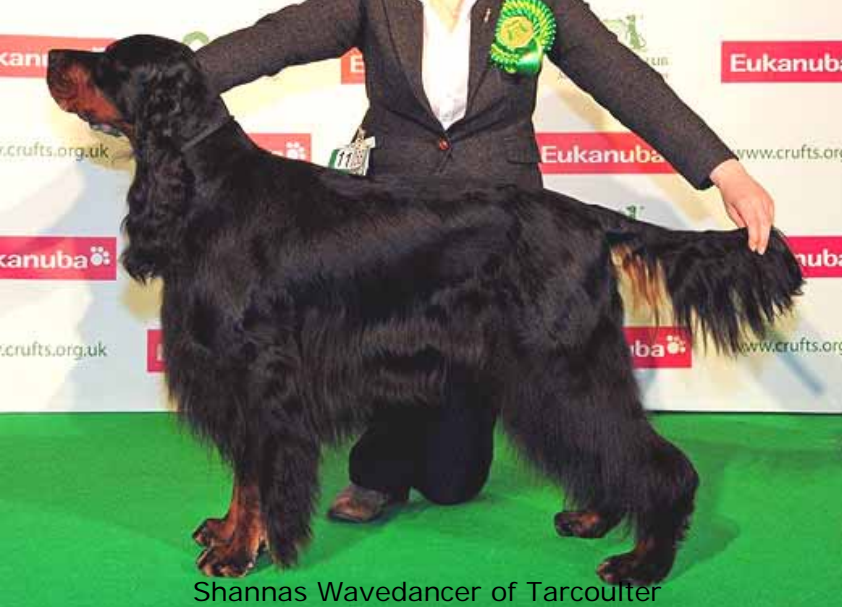
Shannas Wavedancer of Tarcoulter